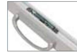
STANDARD Poignée de type mortaise