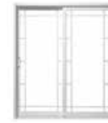
OPTION Carrelage contour