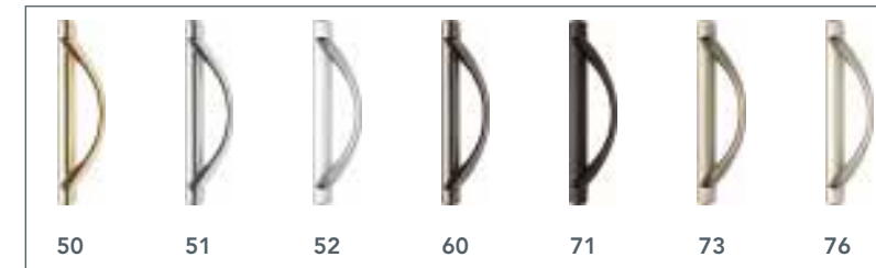
OPTION Poignée Euro

50 Laiton 60 Nickel noir 76 Nickel satiné