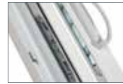
OPTION Poignée multipoints